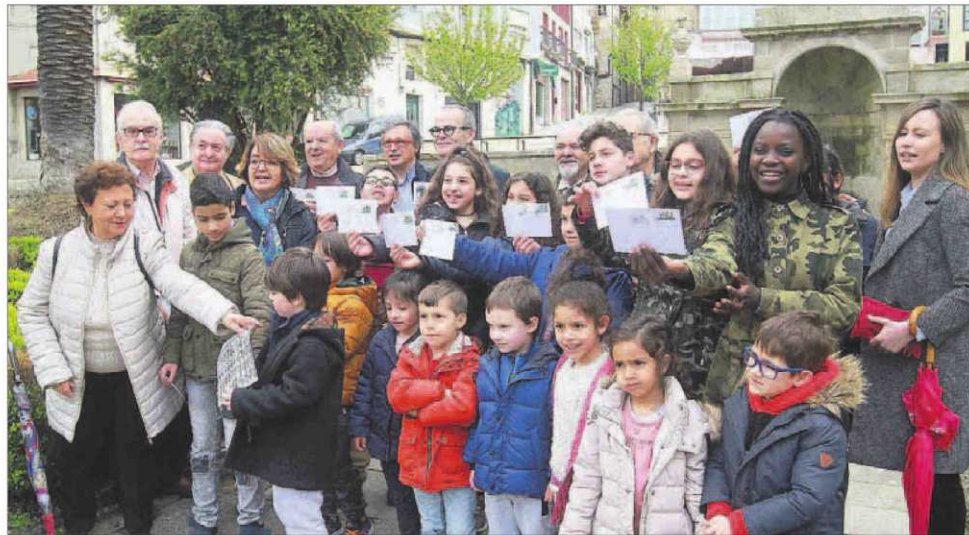
Escolares, numismáticos y el propio alcalde, en As Burgas presentando el sello.

representativo de la ciudad y aparecer en la imagen del sello, con cuya emisión, exclusiva durante el mes de abril, los numerosos atractivos turísticos ourensanos viajarán por carta a cualquier punto de España, con lo que contarán con una gran visibilidad.