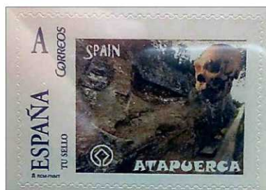
Detalle de un sello sobre Atapuerca. ECB