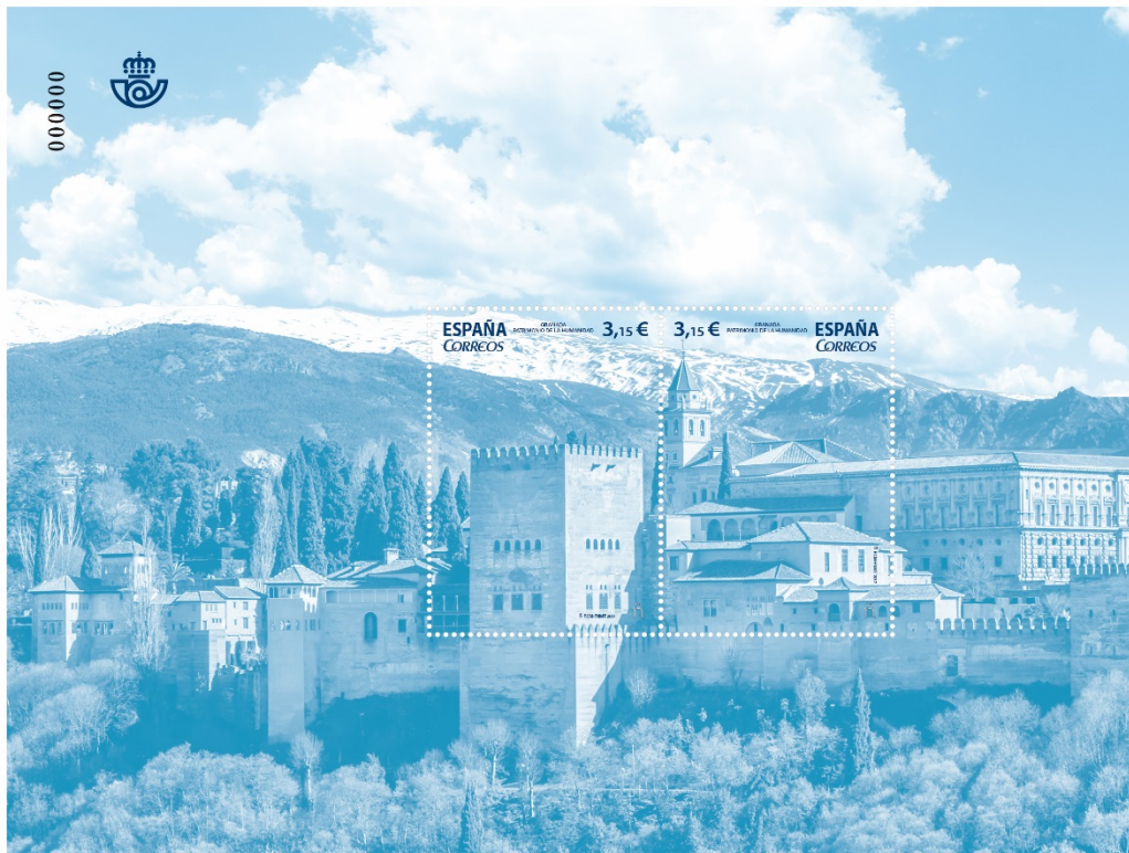
CONJUNTOS URBANOS PATRIMONIO DE LA HUMANIDAD. GRANADA